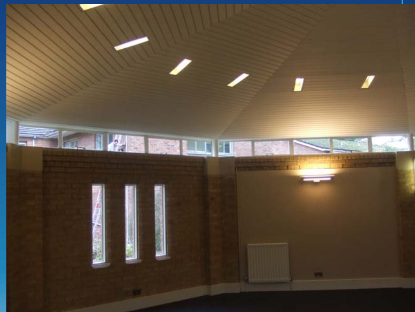
LECTURE ROOM (元チャペル)