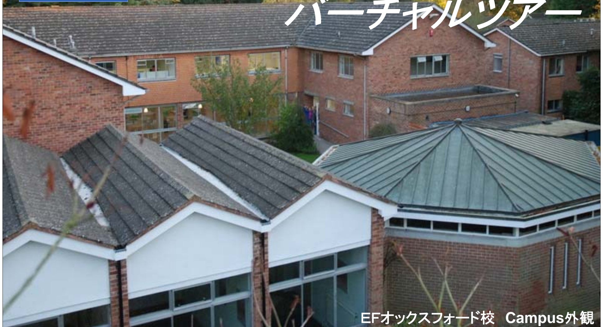
EFオックスフォード校 Campus外観